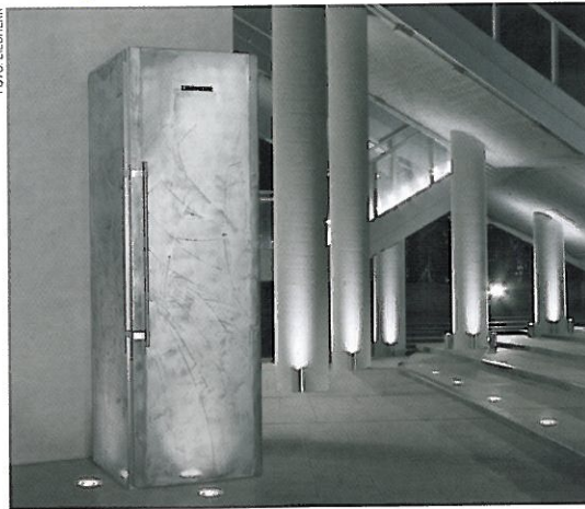
Aufregende Designstudien bei Liebherr - hier: blankes Metall mit Vertiefungen