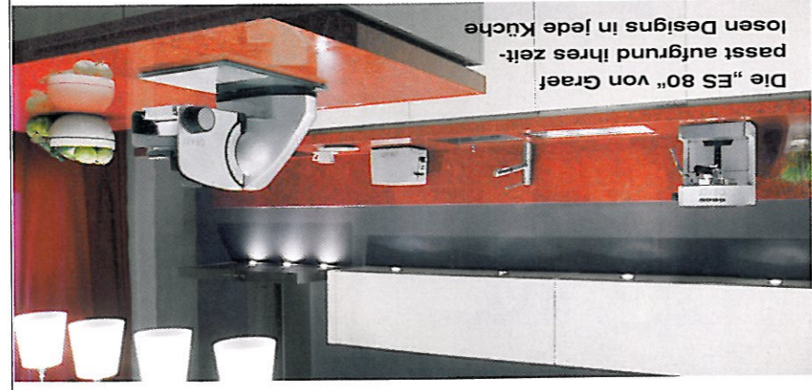
Die „ES 80“ von Graef passt aufgrund ihres zeitlosen Designs in jede Küche