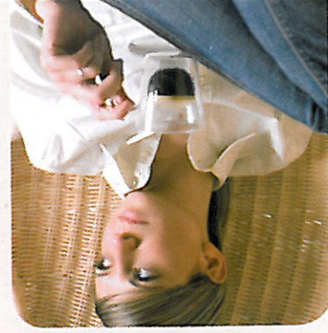
* Erhältlich ab November 2009