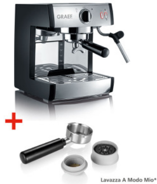
Lavazza A Modo Mio*