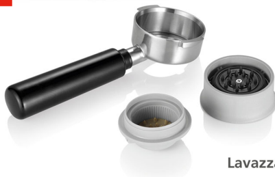
Lavazza A Modo Mio*