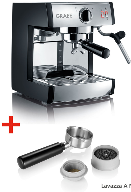
Lavazza A Modo Mio*