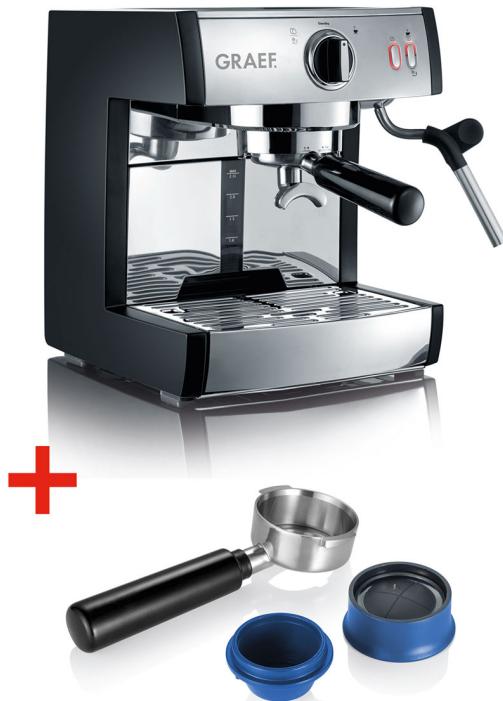
Nescafé Dolce Gusto®*